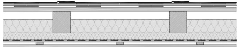
A felújított palafedés rétegrendje utólagos tetőtérbeépítés lehetőségével

A rétegrend kívülről befelé : POLYBOND VB 470 4,5 kg mineral vagy VIRGO P 4,5kg mineral zárólemez VIABIT PRIMER kellősítés felújítandó síkpala fedés tetőlécezés szarufa (kiszellőztetett légrés) tetőtérbeépítés esetén alkalmazható rétegrendek